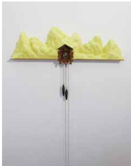
© Jean bonichon, Coucou suisse élevé au beurre Normand , 2015.

Né en 1973 à Montluçon. Il vit et travaille à Nantes