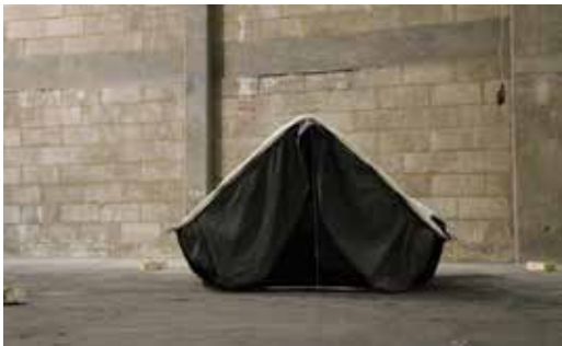
© Boris Raux, Latent(e) on Mercers Road , installation, 2010.

Après une formation scientifique, Boris Raux se tourne vers un matériau plutôt original : l'odeur. Au fil de ses travaux, il élabore ce que nous pourrions appeler une « chronique olfactive de société ». Conscient de la distanciation qu'oblige l'art par rapport à notre vie quotidienne, il y puisse néanmoins son inspiration, sa matière première. Dans le banal, il cherche le phénomène sociétal qui nous permettra de mieux comprendre ce qui nous entoure, ce qui nous construit. Ce n'est pas sans un brin d'autodérision qu'il joue ainsi de nos ambiguïtés, de nos paradoxes et finalement de nous-même.