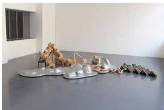
© Julien Laforge, Le travail de la chaîne , 2015.

Au long de ses multiples pérégrinations dans l'espace urbain, Anne Houel s'intéresse à la face cachée des choses, ainsi les états ou réserves de construction deviennent à ses yeux de véritables sculptures abstraites. La série "Dérive" qu'elle a réalisée en 2014 évoque le terme géologique de la dérive des continents, ou comment, selon la théorie du physicien Alfred Wegener, nos continents actuels en formaient autrefois un seul (la Pangée). Par cette référence, Anne Houel renvoie la notion de mutations urbaines à la nuit des temps et à l'essence-même d'évolution géologique.