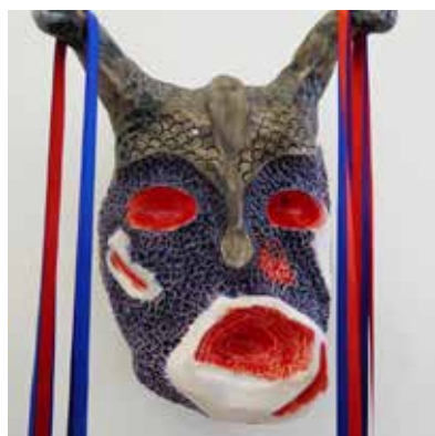
© Romuald Dumas- Jandolo, Les caprices , 2017.