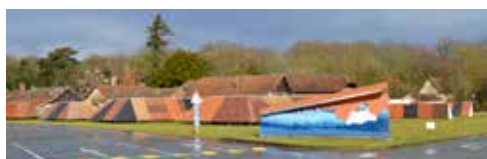
© Blandine Brière, Dessous , 2017.

Le travail de Blandine Brière se situe entre la recherche et l'écriture documentaire. L'artiste cherche à garder des traces artistiques à partir de rencontres, en exploitant une très grande diversité de matériaux : matériaux bruts, bois de construction, latex prévulcanisé, acier, plâtre, tuiles etc. Ces matériaux lui permettent de réaliser des formes hybrides sonores et sculpturales. Elle tend à valoriser le vivre-ensemble à travers l'expérimentation sonore.