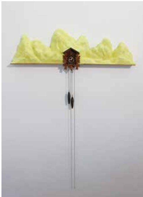
© Jean Bonichon, Coucou suisse élevé au beurre Normand , 2015