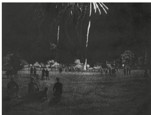
© Thomas Levy-Lasne, Le feu d'artifice , fusain sur papier, 2018.

Né en 1980 à Paris. Il vit et travaille aux Lilas