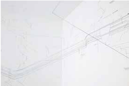
© Keita Mori, Bug report , Fil de coton et fil de soie sur mur, 2015.

Né en 1981 au japon. Il vit à paris et travaille à Montreuil