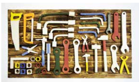
© Cédric Guillermo, Passe moi la clefs de treize , bois et céramique installation, 2016.

Né en 1986. Il vit et travaille à Saint Jean-Brévelay, Bretagne