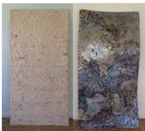
Tryptique, plaque métal et bois, 2018.