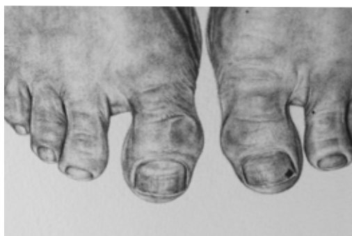
© Gisèle Bonin, Dessin , 2015.

Née en 1975. Elle vit et travaille à Angers