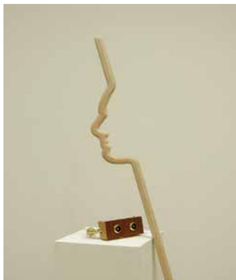
© Alexis Debeuf, Autoritratto , 2015.

Artiste bricoleur, volontairement touche à tout, Alexis Debeuf manipule ce qu'il trouve autour de lui pour s'exprimer sur le monde qui l'entoure. Avec un regard citoyen sur les situations économiques et politiques de nos sociétés, il invente ses propres règles, détourne les signes, les usages créant un décalage avec le réel. Ses oeuvres sont réalisées à partir d'objets familiers et toujours au contact des matériaux, son "bric à brac", souvent bancal, propose des situations burlesques, des petits moments de poésie pour survivre à la routine et tourner en dérision le monde contemporain. Joueurs, rieurs, « optimistes » les objets d'Alexis Debeuf font alors acte de résistance.