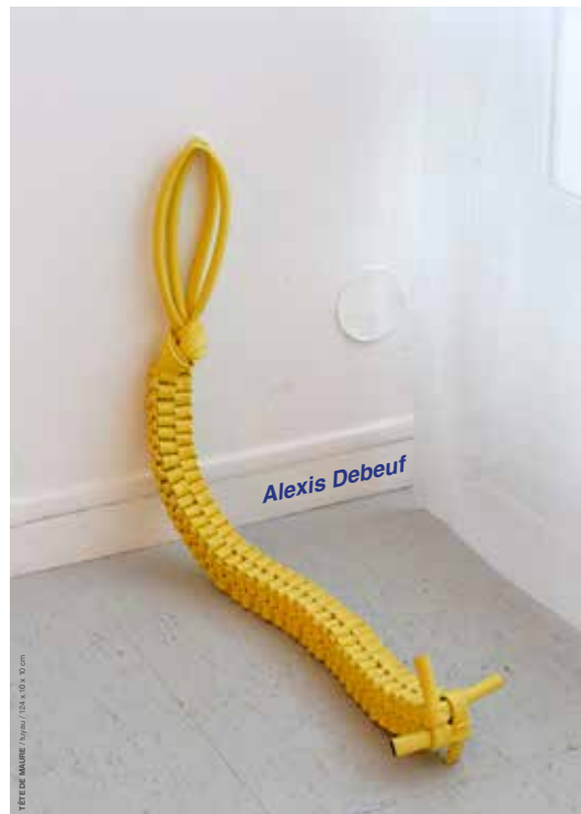
© Alexis Debeuf, Tête de maure , 2015