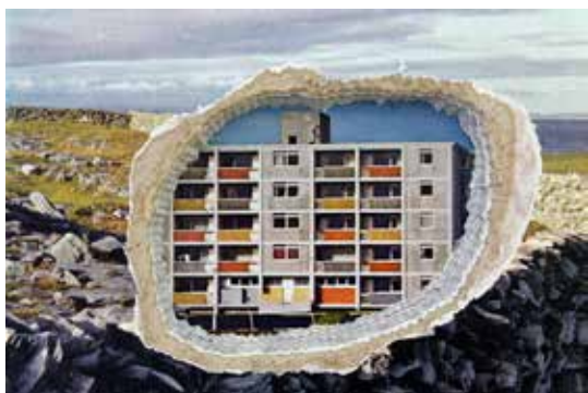
© Anne Houel, Encyclopédie Life autour du monde , série Dérive, 2014.