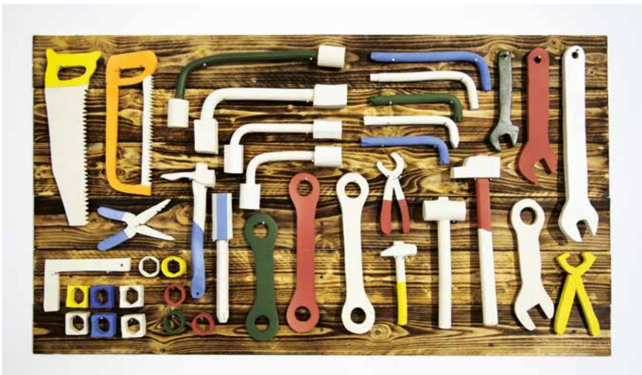
© Cédric Guillermo, Passe-moi la clef de treize , installation en bois et céramique, 2016.