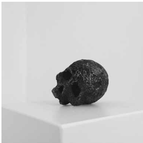
© John Cornu, Fronde , météorite tombé en Argentine, 2010.

John Cornu propose une esthétique héritée du minimalisme et du modernisme tout en convoquant un rapport fort au contexte historique ou sociétal. S'intéressant à des thèmes comme la ruine moderne, les logiques de pouvoir ou encore le passage du temps, l'artiste instaure dans ses productions une atmosphère à la fois poétique et sans concession.