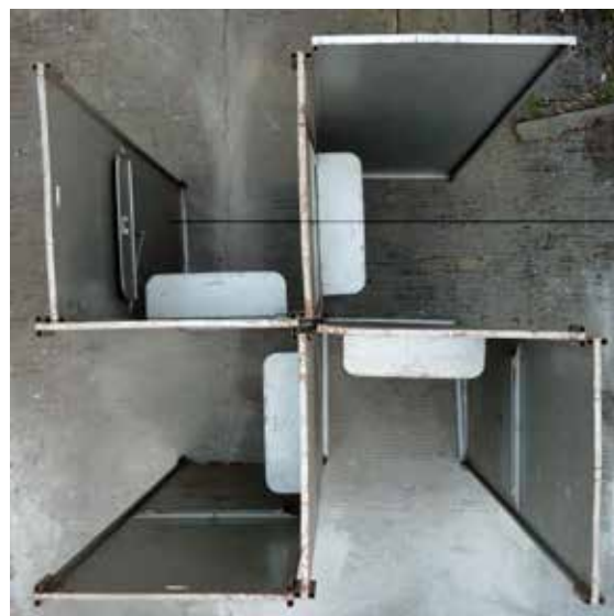
© Boris chouvellon, Sans titre , photographie, 2011