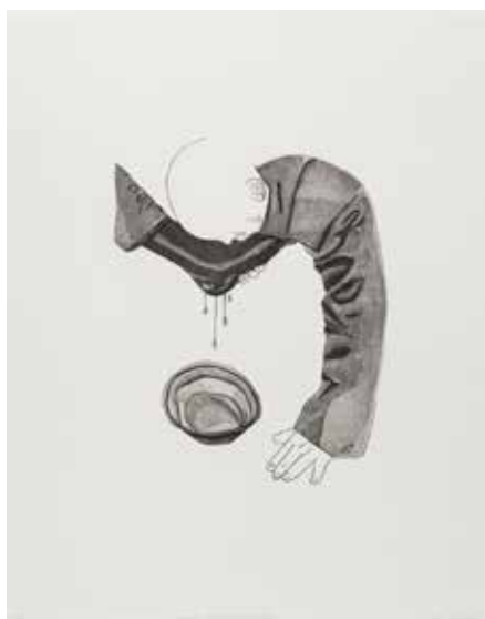
© Marie Aerts, Servitude volontaire , eau forte et aquatinte, 2015.