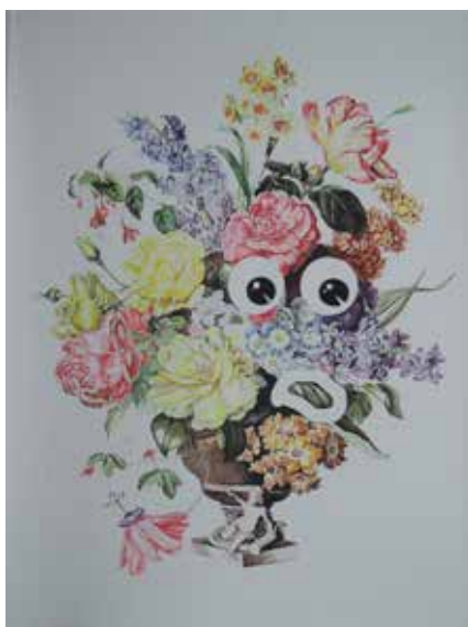
© Emilie Breux, : 0, crayon de couleur sur papier, 2014.

Née en 1985 à Lisieux. Elle vit et travaille à Paris