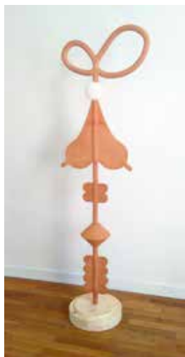
© Leticia Martinez Perez, Tetislap , sculpture en bois, 2018.

Née en 1980. Elle vit et travaille entre Caen, Paris et Zaragoza (Espagne)